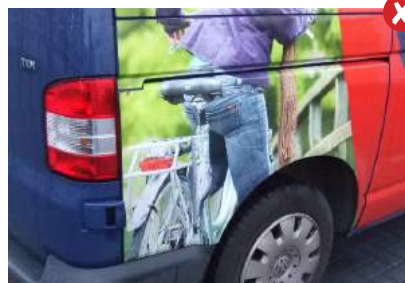
Reclame op auto's