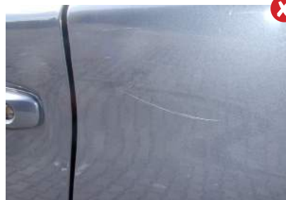
Krassen door de lak heen