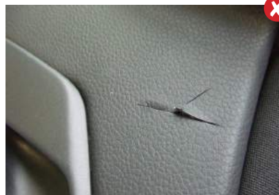
Scheuren in de bekleding