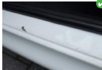
Dorpels beschadigd door instappen