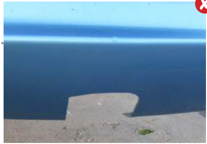
Schade door verwijderen accessoires

Schade als gevolg van het verwijderen van eigen accessoires is niet acceptabel.