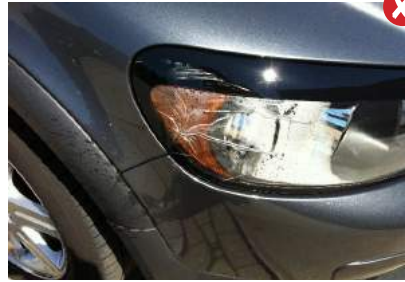
Kop- of mistlamp beschadigd