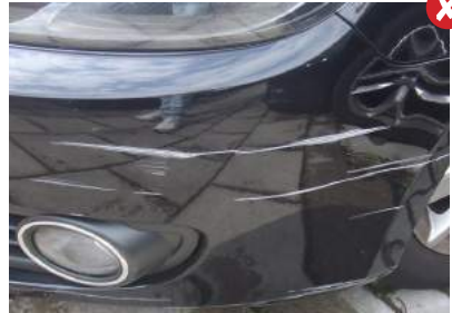
Schaafschade op bumpers

Alle wieldoppen dienen aanwezig te zijn.