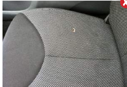
Brandgaten in bekleding

Alle reclame op auto's, gespoten of geplakt, wordt beoordeeld als niet acceptabel. Een auto dient zonder reclame te worden ingeleverd.