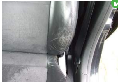
Slijtplekken op bestuurdersstoel