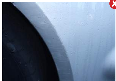
Schaafschade op bumpers