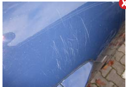
Krasjes bij de portiersloten