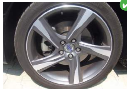
Velgen licht beschadigd