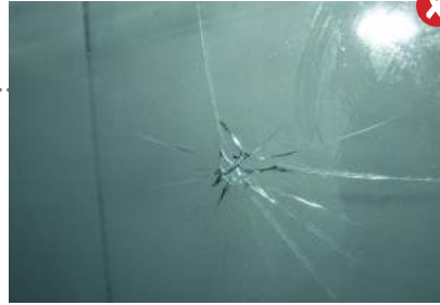
Grote ster in de ruit is niet acceptabel

Interieurvlekken die met normale schoonmaakmiddelen verwijderd kunnen worden, zijn acceptabel.