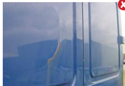
Deuken van binnen naar buiten

Deuken van binnen naar buiten ontstaan door het onvoldoende vastzetten van de lading of door het laden van het voertuig. Deze deuken zijn niet acceptabel.