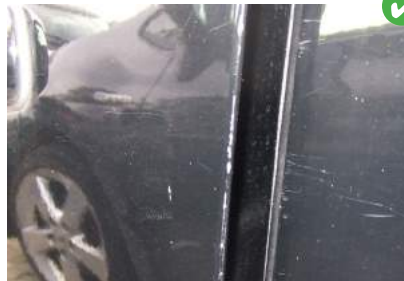
Lakbeschadiging aan deurranden