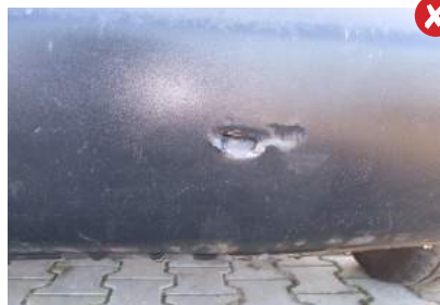
Gaten en scheuren in bumpers