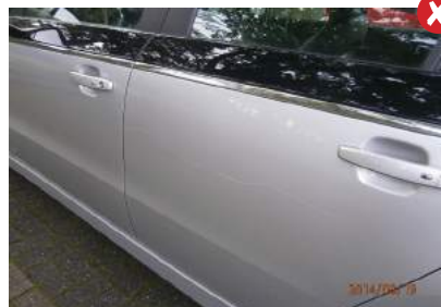
Krassen door de lak heen